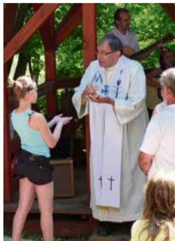
A 8. Ghymes Fesztiválon, 2013-ban Hegymagason tartott szentmisét