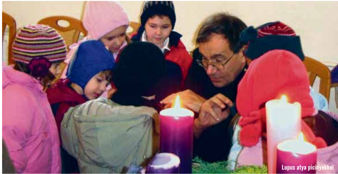
Lupus atya picinyekkel