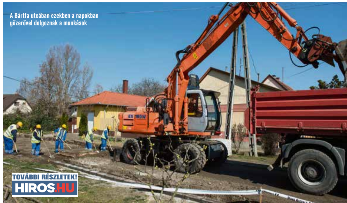
A Bártfa utcában ezekben a napokban gőzerővel dolgoznak a munkások