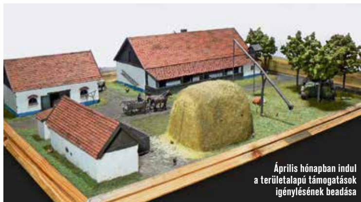
Április hónapban indul a területalapú támogatások igénylésének beadása

– Lehet, hogy nem mindenki tudja önről: megyei kamarai elnöki munkája mellett mezőgazdasági vállalkozóként is tevékenykedik. Milyen szakterületen teszi ezt?