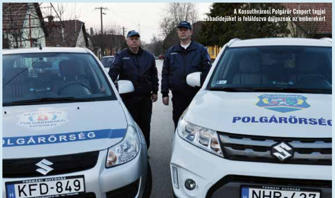
A Kossuthvárosi Polgárőr Csoport tagjai szabadidejüket is feláldozva dolgoznak az emberekért

Polgárőreinket folyamatosan képezzük. Részt veszünk az Országos Polgárőr Szövetség 2016-ra meghirdetett Nagyvárosi Bűnmegelőzési Programjában. Ezzel is próbálunk még nagyobb hangsúlyt fektetni munkánk minőségére, a kollégák kul-