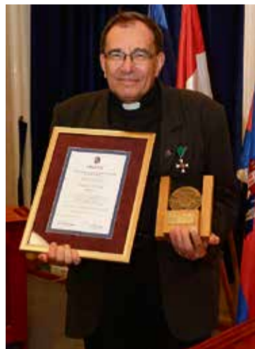
2015-ben a Pro Urbe Mosonmagyaróvár elismeréssel