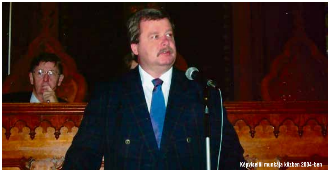
Képviselői munkája közben 2004-ben