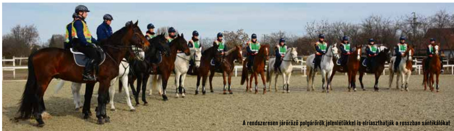
A rendszeresen járőröző polgárőrök jelenlétükkel is elriaszthatják a rosszban sántikálókat