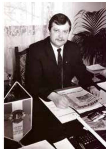
A Kecskeméti Rt. vezérigazgatójaként