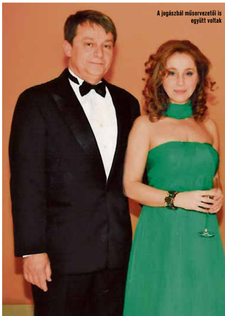
A jogászbál műsorvezetői is együtt voltak

D. J. – Nagyon szeretjük ezeket a darabokat, de nehéz lenne megmon-