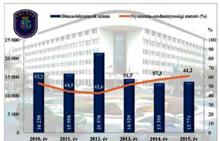
Összes bűncselekmény Bács-Kiskun Megyei Rendőr-főkapitányság

Bár a főkapitányság nyomozó hatósági 2,8%-kal több bűncselekmény ügyében nyomoztak, a megye területén a bűncselekmények száma közel azonos szinten maradt. A 2015-ös hatázzárral kapcsolatban elkövetett 218 bűncselekménytől eltekintve 0,9%-os csökkenés figyelhető meg. A megye nyomozás-eredményessége (3,9%-kal) 61,2%-ra javult, amely az elmúlt hat év legjobb eredményének tekinthető.