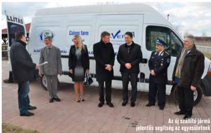
Az új szállító jármű jelentős segítség az egyesületnek

– Nagy öröm számunkra, hogy megkaptuk ezt a szállító járművet. Rendkívül nagy a területünk, Szeleifalutól Matkón át Kisfáig. Ez megnehezíti a járőrözést. Az autóval ki tudjuk vinni a területre a lovakat, így sokkal több helyre eljuthatunk, mint eddig. A szállító két lovat tud biztonságosan és kényelmesen utaztatni, de bővíthető egy utánfutóval, akkor egy-egy helyszínre akár négy ló is eljuthat. Egyesületünk ötven tagjából huszonhat lovas polgárőr.