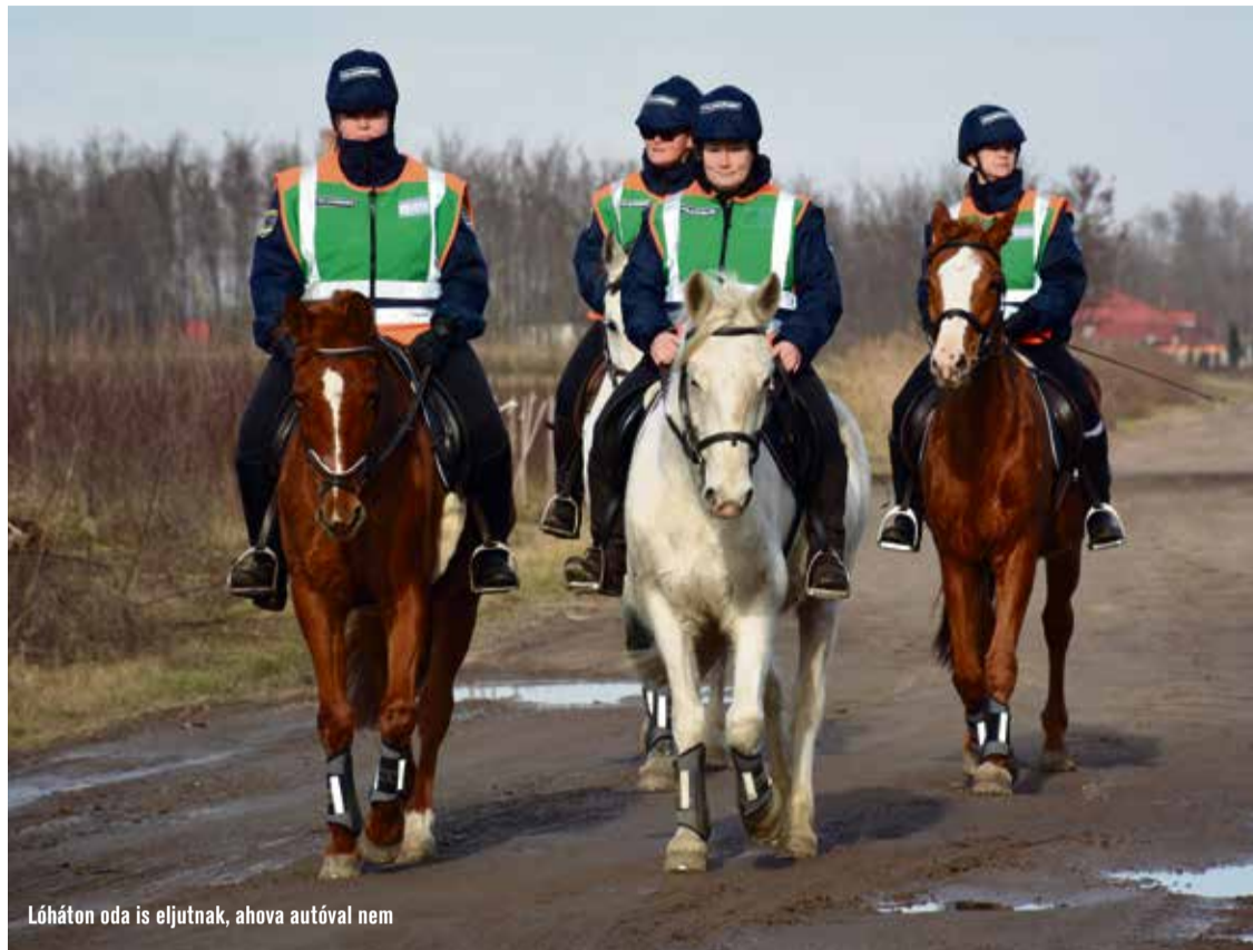
Lóháton oda is eljutnak, ahova autóval nem

– Ezzel az autószállással kettős célt tudunk szolgálni. Egyrészt hozzájárulhatunk ahhoz, hogy a lovaspolgárőrök minél nagyobb területet járhassanak be és ellenőrizhessenek, javítva ezzel az ott élő emberek biz-