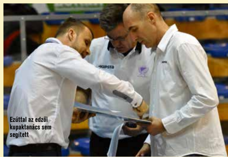
Ezúttal az edzői kupatanács sem segített

Papírforma győzelmet aratott Székesfehérváron a KTE-Duna Aszfalt kosárlabdacsapata ellen a TLI-Alba Fehérvár. A hazaiak 93-69 arányban múlták felül a mieinket, akik lapzártánk után, szerdán este a jelenlegi sereghajtó Jászberény otthonában léptek pályára.