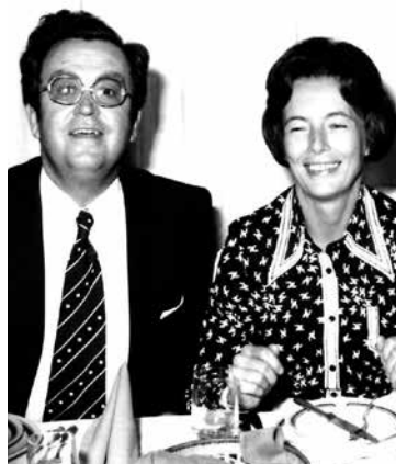
Feleségével Kecskemétre költözésük után néhány évvel