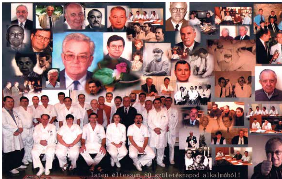
Isten éltesse 80. születésnapod alkalmából!