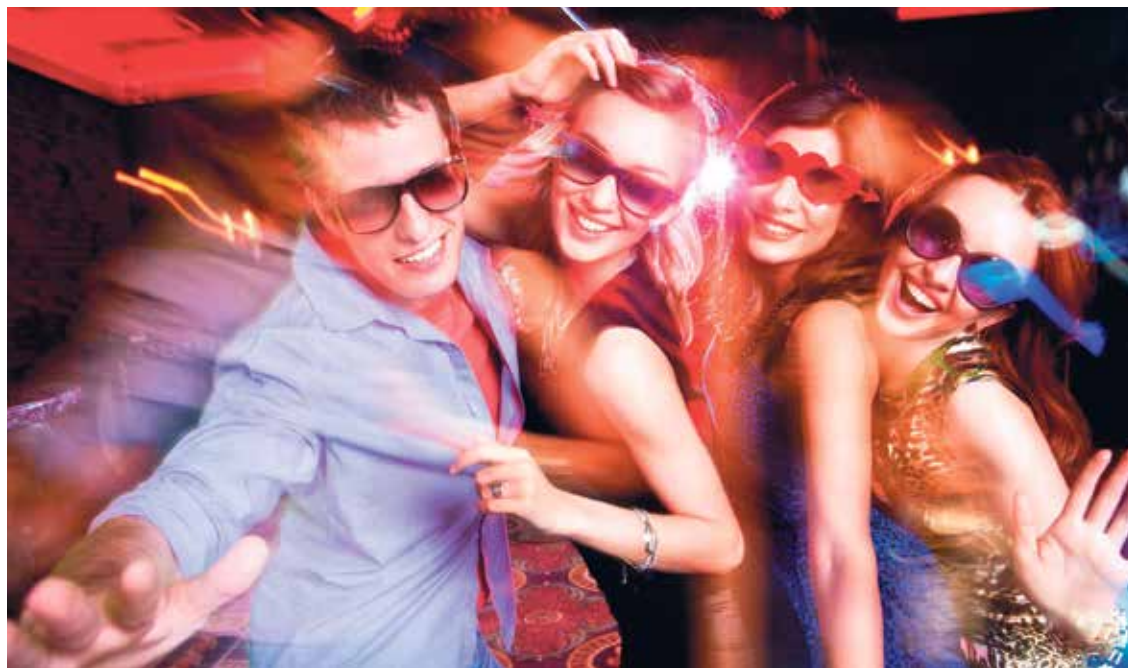
A buli másnapján keserves lehet a kijózanodás

Kellő tapintattal, profizmussal és empátiával kezelhetők a kritikus szituációk. A lényeg, hogy mindig az előadóművészeknek kell okosabbnak lenni. A céges buli külön műfaj. Mert ott aztán nagyon részegek a vendégek, hiszen korlátlan az italfogyasztás. Sokan vannak a cég dolgozói között, akik rengeteget dolgoznak, és lehet, hogy csak évente egyszer, egy ilyen bulin tudnak ebben a körben szórakozni. A profizmushoz hozzá tartozik, hogy kicsit pszichológus vagy, kicsit pedagógus, akinek oda kell figyelnie a vendég lelkivilágára, mert egy félreértett gesztus elég ahhoz, hogy elinduljon a lavina.