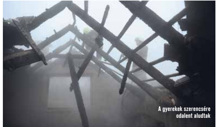
A gyerekek szerencsére odalent aludtak

– Sajnos semmi megtakarításunk nincsen, örülünk, hogy tisztességesen nevelhetjük a gyerekeinket – mondják. – Így azonban nagyon nehéz új otthonot találni. Jártunk a KIK-FOR Kft.-nél, hátha kapunk bérlakást, de ahhoz 120 ezer forint kauciót kellene letennünk. Épp a tüzeset előtt fizettük be a csekket, és elintéztük a nagybevásárlást, így lényegében kiürült a családi kassza. A Máltai Szeretetszolgálat és a Kecskeméti Nagycsaládosok Egyesülete is megkeresett minket, élelmiszert, sőt