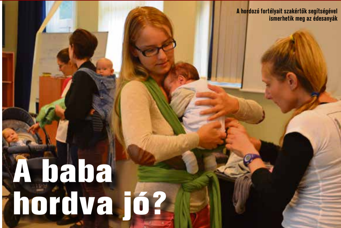
A hordozó fortélyait szakértők segítségével ismerhetik meg az édesanyák

A baba testközelben való hordozása a tehermentesítésen túl számos előnnyel jár, hiszen erősíti a kötődést a szülők és a csecsemő között, és ezzel összefüggésben csökkenti a szülés utáni depresszió kialakulásának