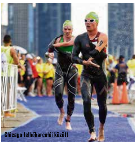
Chicago felhőkarcolói között