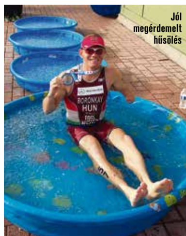
Jól megérdemelt hűsülés