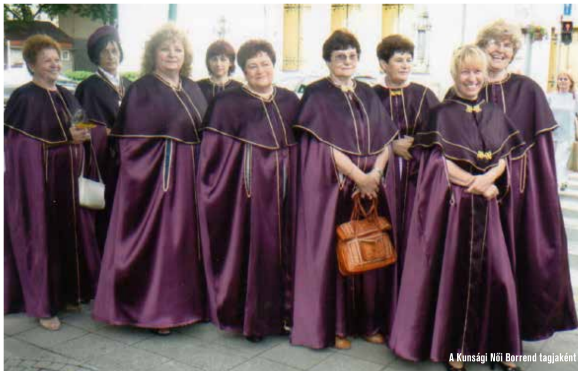
A Kunsági Női Borrend tagjaként