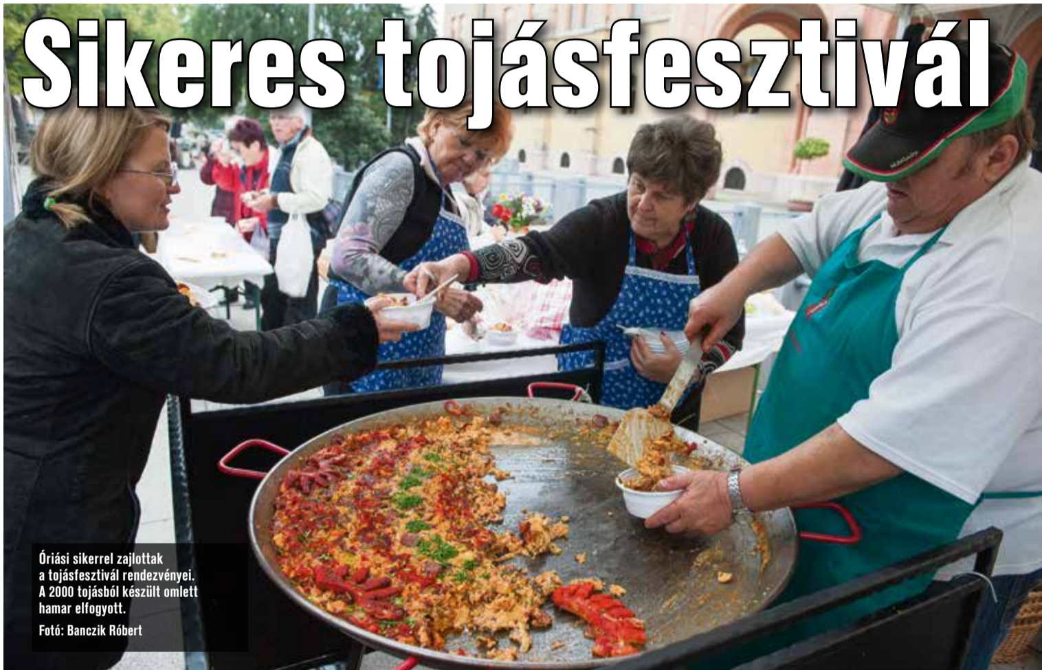
Óriási sikerrel zajlottak a tojásfesztivál rendezvényei. A 2000 tojásból készült omlett hamar elfogyott.