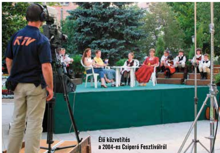
Élő közvetítés a 2004-es Csiperó Fesztiválról