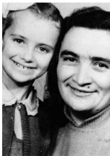
Édesanyjával nyolcéves koromban