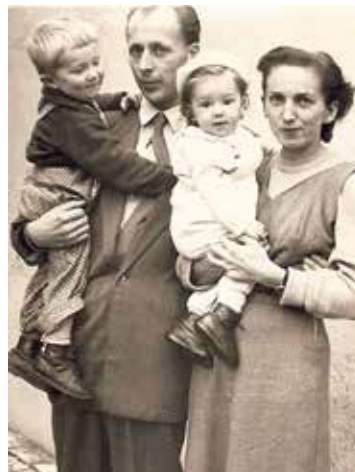
„A szüleim nagyszerű emberek voltak.” – Szüleiével és húgával háromévesen