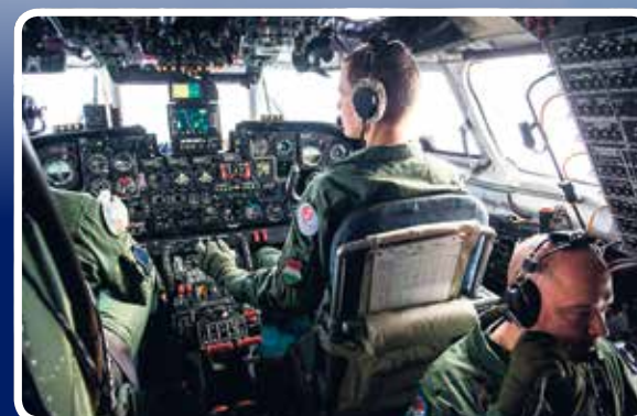
Litvániába csaknem kilencvenen települtek ki