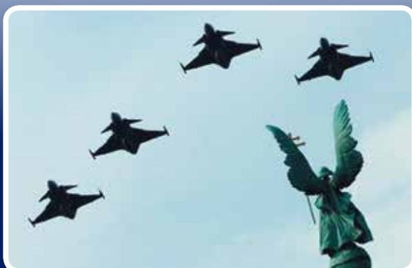
Nemzeti ünnepeink fényét is emelik a Gripen-kötelékek