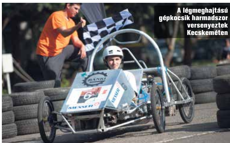
A légmeghajtású gépkocsik harmadszor versenyeztek Kecskeméten

A pneumobilok, vagyis légmeghajtású gépkocsik gálafutamát nemrégiben harmadszor hozta városunkba a házigazda Kecskeméti Főiskola. A helyszín, a Rudolf laktanya, tulajdonképpen szimbolikus: ugyanis, ahogy Gaál