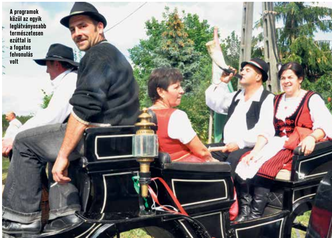
A programok közül az egyik leglátványosabb természetesen ezúttal is a fogatos felvonulás volt