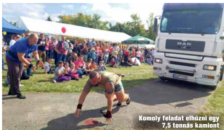
Komoly feladat elhúzni egy 7,5 tonnás kamiont