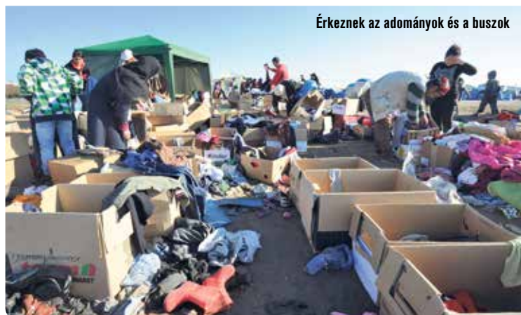
Érkeznek az adományok és a buszok

A tábor elhagyása egyébként nem jelent különösebb nehézséget a migránsoknak, mert a mobil kerítéseket könnyűszerrel el lehet mozdítani, a rendőrök nem használhatnak semmilyen kényszerítő eszközt.