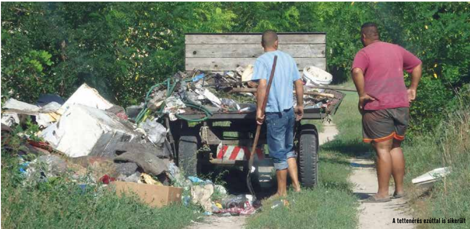
A tettenérés ezúttal is sikerült