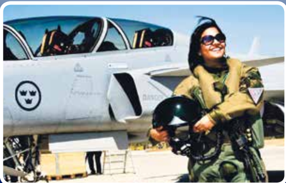
A Gripeneket ezúttal nem svéd pilóták viszik északra

A NATO németországi Uedemben található Egyesített Légvezetési Központjával folyamatos a kapcsolat, riasztás esetén a NATO előírásoknak megfelelő módon gyorsan és hatékonyan képes reagálni a magyar csapat. A szövetség alapokmányában rögzített negyedik és ötödik cikkely következetes szolgálatát ezekben az időkben, amikor az ukrán válság nyomán feltámadó nagyhatalmi erő politika napjait éljük. Vagyis a magyar kötelék jelenléte egyértelműen a Baltikumra nehezedő orosz katonai nyomás „ellensúlyozására” tett NATO-lépések egyike.