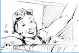
A vizalatti felvételekhez speciális kamerát használtak