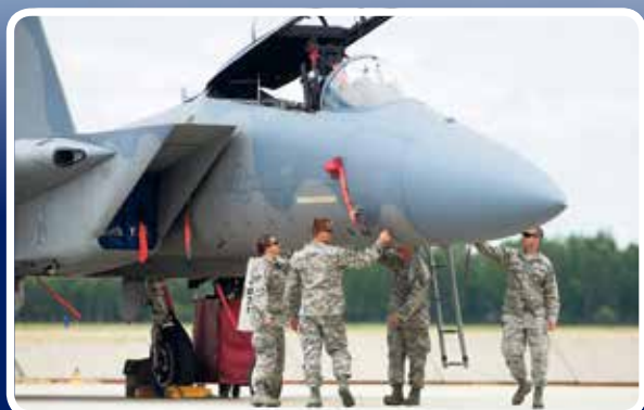
Kecskeméti betonon az amerikai F 15-ös vadászgépek

Mondhatom, hogy jó érzés itt lenni. Először vagyok egy kontingensnek a parancsnoka külföldön, ráadásul a csapat nyolcvan százaléka a kecskeméti bázisról jött, tehát kollégáim, elég jól ismerem őket és mondhatom: otthon is és itt kint is kiváló munkát végeznek.