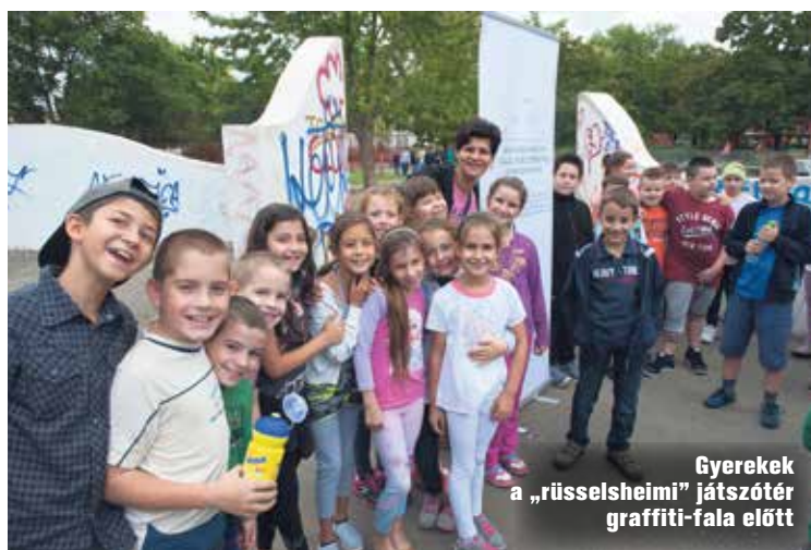
Gyerekek a „rüsselsheimi” játszótér graffitifalánál

helyszíne családi és közösségi programoknak is. A szalagátvágás után a gyerekek azonnal birtokukba vették a pályát, a KTE Duna Aszfalt felnőtt játé-