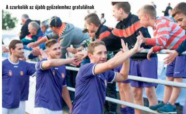
A szurkolók az újabb győzelemhez gratulálnak