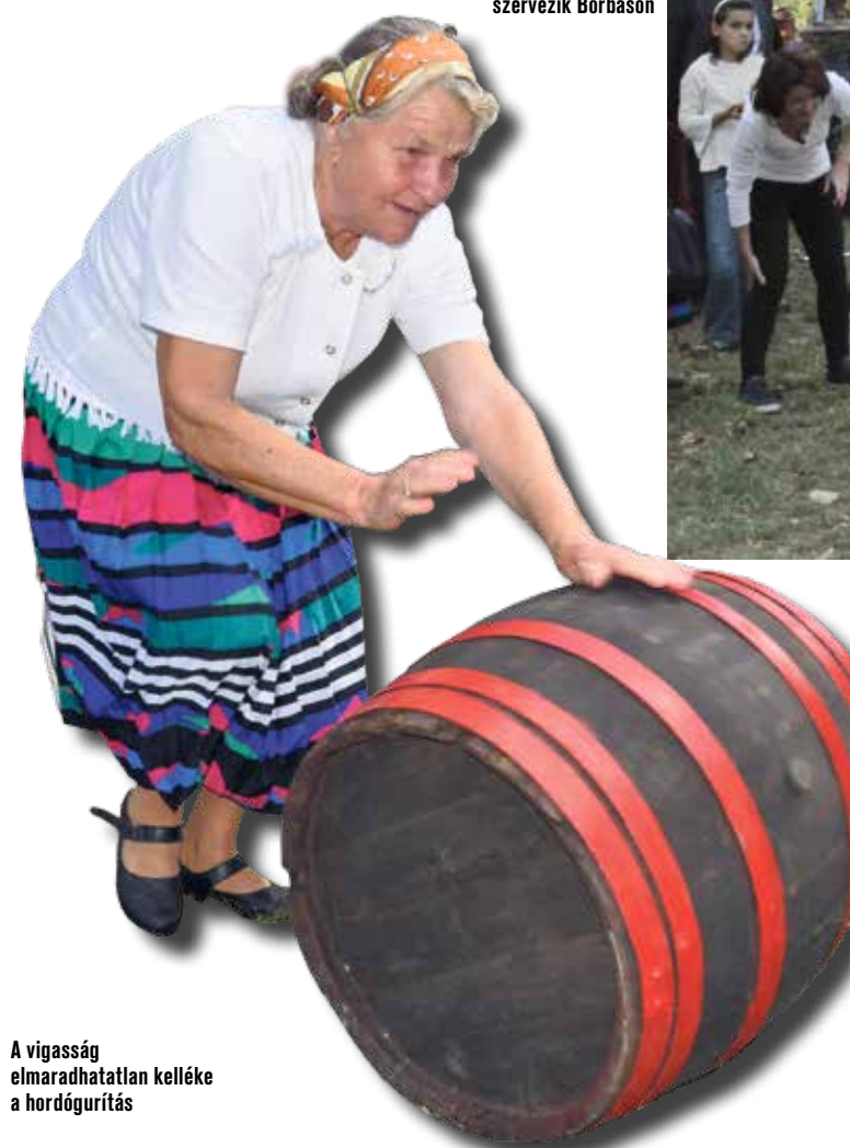
A vigasság elmaradhatatlan kelléke a hordógurítás