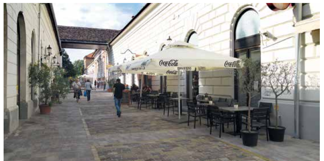
A Kéttemplom köz 12. szám alatti üzlethelyiség felújítását a „Szabadság tér és környezetének funkcióbővítő városrehabilitációja” című, DAOP-5.1.2/C-14-k-2-2014-0001 azonosító számú projekt keretében végezte el a KIK-FOR Kft.

Mert itt aztán nincsenek más zajok. Nem pöfögnek orruk alá az autók, nem száguldanak a berregő robogósok. Itt csend van, tiszta levegő, béke és nyugalom. Meg kedves, vidám személyzet. Meg sok akció is van. Mert a Pizza Sprint ilyen. Hogy milyen akciókkal és kínálattal várnak? Kétszáz-kétszáz! A kétszázát! Ha ezt megjegyzi és tárcsázza, mindent megtudhat. Rendeljen, vagy jöjjön a Kéttemplom közbe! Ha semmi nem jön közbe.