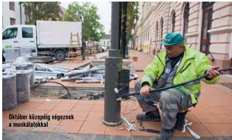
Október közepéig végeznek a munkálatokkal

Nos, kít ne zavarna, ha a városban járva-keve a korábbi, bevett csapásirányait átvágják, eltérítik. Pláne, ha mindezt a várakozásaihoz képest el-