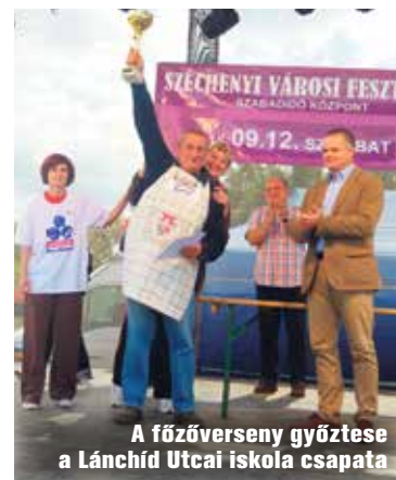
A főzőverseny győztese a Lánchíd Utcai iskola csapata