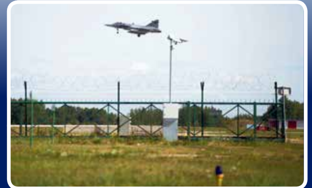
Magyar Gripen száll fel a litvániai Siauliai bázisról