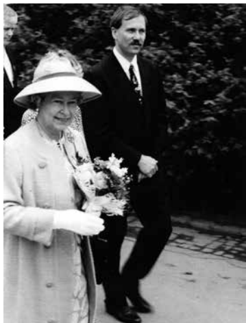
„Megható atmoszférája volt ennek a látogatásnak.” – Erzsébet királynővel 1993 májusában, Kecskeméten