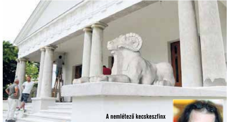
A nemlétező kecskeszfinx