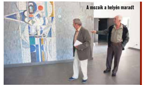
A mozaik a helyén maradt

Kedves Olvasónk! Ha vannak élményeik az egykori Városi mozival kapcsolatban (első csók, legtöbbszor látott film, leghosszabb sorban állás, legvidámabb pillanatok...), ossza meg velünk az info@hiros.hu címen, vagy Facebook oldalunkon (Facebook.com/hiros.hu)!