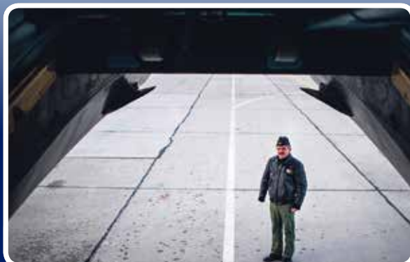
Az áttelepülés is komoly műszaki feladatot jelent