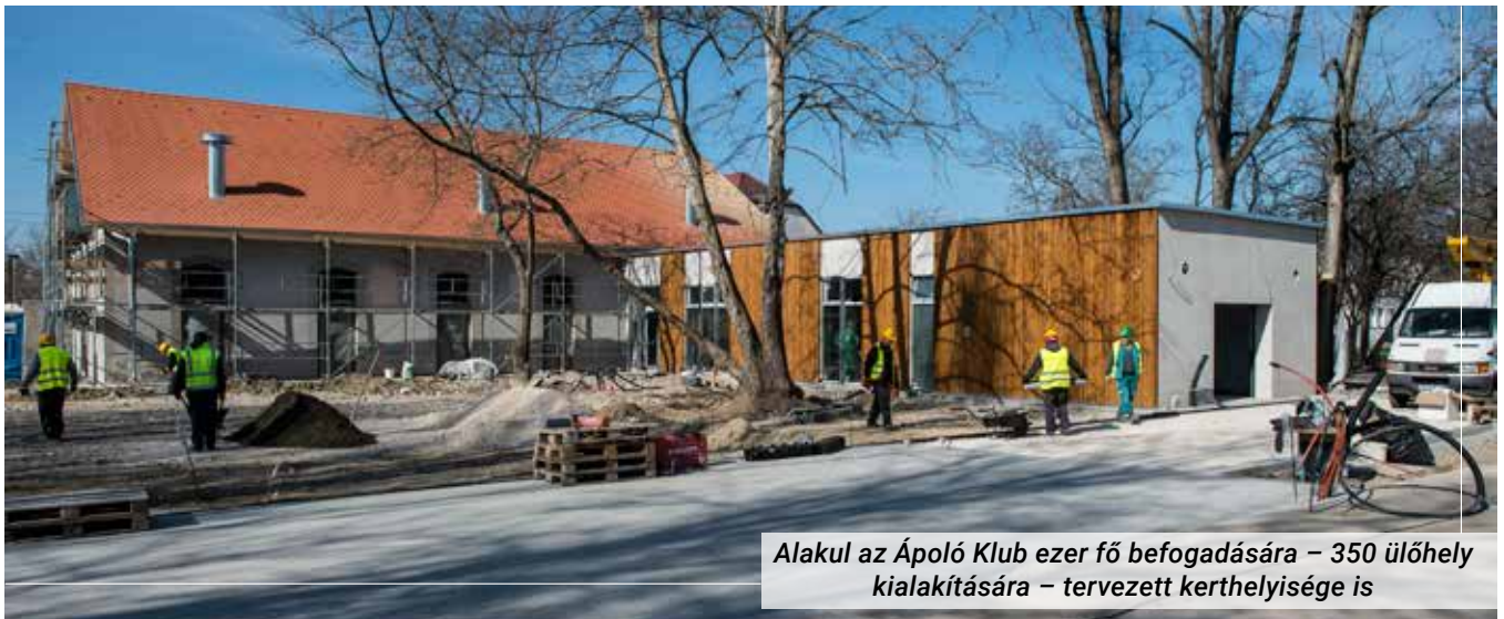
Alakul az Ápoló Klub ezer fő befogadására – 350 ülőhely kialakítására – tervezett kerthelyisége is

Az alapítók 44,8 millió forintért vásárolták meg az 1600 négyzetméteres telket, ebből 300 négyzetméteres az épület, és hozzáépítenek még egy közel 100 négyzetméteres kiszolgáló létesítményt. A beruházást hitelből valósítják meg, kilencéves futamidő mellett. – Ebből is látszik, hogy az üzleti tervünk nem a gyors meggazdagodáson alapszik. Hosszú távra tervezünk, szeretnénk Kecskeméten egy olyan kultuszhelyet létrehozni, amilyenre még nem volt példa. Egy olyan helyet, hogy ha a városra gondol az ember, a szórakozásról ez legyen az első, ami az eszébe jut.