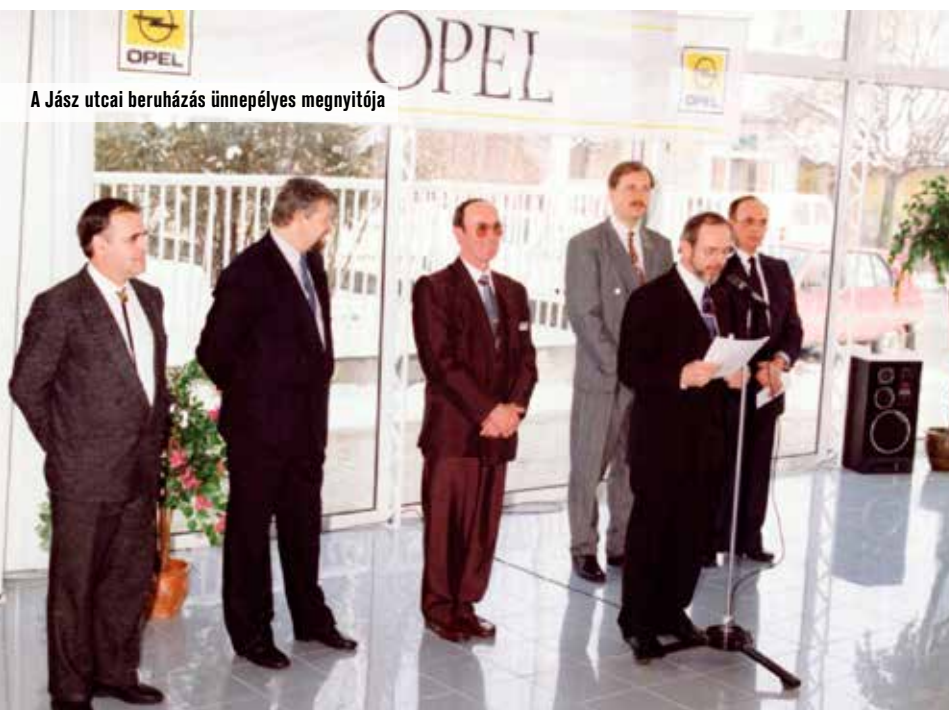
A Jász utcai beruházás ünnepélyes megnyitója

A német bank két év türelmi időt adott. Ebben az időben a tőkét nem, csak kamatot kellett fizetni, így adtak időt arra, hogy megerősödjön az