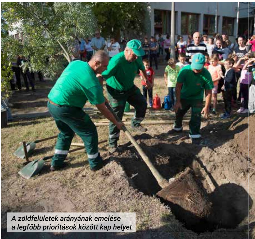
A zöldfelületek arányának emelése a legfőbb prioritások között kap helyet

– Teljes politikai és társadalmi egyetértés mutatkozik abban, hogy az illegális hulladéklerakással szemben komolyan fel kell lépni. Az önkormányzat évek óta jelentős erőfeszítéseket tesz a felderítés hatékonyságának javítására (például a bejárásra, a lakossági és civil összefogás erősítésére, az illegális hulladéklerakás bejelentésére), illetve a tettenérésre (kamerák kihelyezése az érintett területekre, nagyobb közterületi rendszeti jelenlét, drón alkalmazása), melyet jogi és pénzügyi eszközökkel igyekszik szankcionálni. A jelzett tevékenységnek a jövőben még hatékonyabbnak, a retorzióknak pedig nagyobb elrettentő erejűnek kell lennie, ezen dolgoznak az érintett szakemberek.