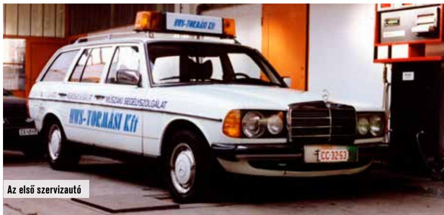
Az első szervizautó

utca 69. szám alatt található műhelyt, ahol inas volt. Öt év múlva már heten dolgoztak a szervizben.