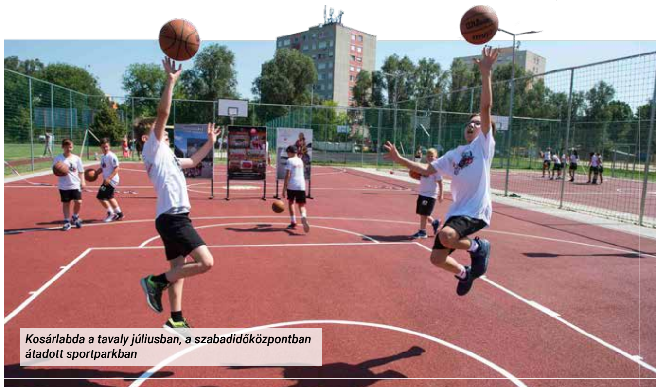
Kosárlabda a tavaly júliusban, a szabadidőközpontban átadott sportparkban

– Tisztázzuk, hány terület tartozik a Hírös Sport Nonprofit Kft.-hez? Ezeket lehet rangsorolni akár fontosság, akár nyereség tekintetében?